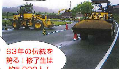
建設機械運転講習